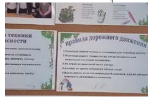
Информация в классном уголке 5 б класса