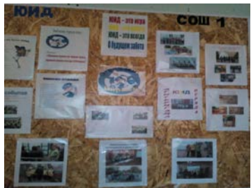
Стенд отряда ЮИД "Виражи" в коридоре СОШ №1 (корпус2)