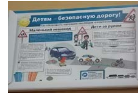
Информация в классном уголке 5 в г классе

Информационный стенд в фойе СОШ №1 (корпус2)