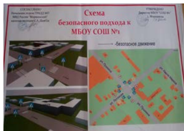
Схемы безопасного маршрута фойе СОШ№1 (корпус2)

Информационный стенд в фойе СОШ №1 (корпус2)